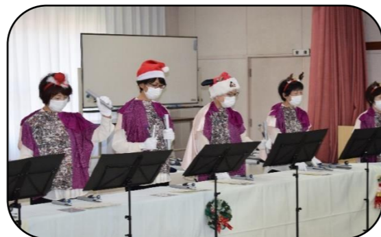
昨年の様子。きれいな音色でした。

日時 12月2日(金) 午後1時30分～午後3時 場所 塩津公民館 2階 講義室 参加費 無料