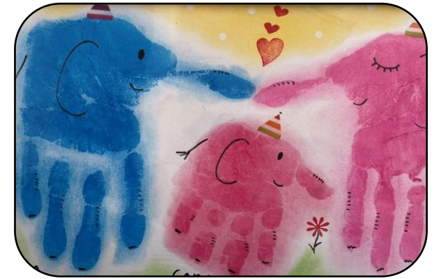
手のひらを使ってゾウの親子を描きました。(カラー版は公民館のホームページをご覧ください)